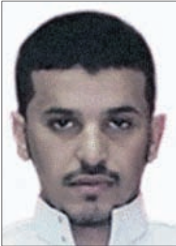
Expertonan Mericano ta sospecha cu e bom sofisticada camufla den paña intimo tabata un obra macabro di e especialista, Ibrahim Hasan al-Asiri.

WASHINGTON (AP) — Agencia di Inteligencia Mericano, esta CIA a frustra un plan terrorista di e grupo al-Qaida na Yemen. E obhetivo tabata ataca un avion di pasaheronan cu destino Merca dor di un bom fabrica cu un diseño nobo y masha sofisticada. E atake aki tabata programa un año despues cu e forsa special di Merca a mata e lider terrorista Osama bin Laden, asina autoridadnan Mericano a informa na The Associated Press.